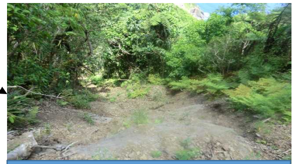
ルート下部の状況 (R6.7.2)

問合せ先: (指定ルート関係) 小笠原諸島森林生態系保全センター(2-3403) (観光利用関係) 小笠原母島観光協会(3-2300)