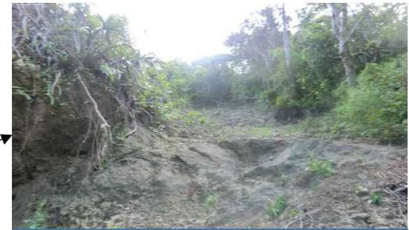
ルート上部の状況 (R6.7.2)