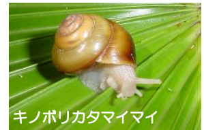
キノボリカタマイマイ

小笠原諸島は固有種が多く、生物が様々な場所に適応して進化した証拠がよく残っている。また、面積が小さい割に、陸貝と植物の固有種の割合が特に高い。