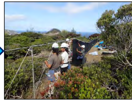
図 ネット据付状況 (接続部分は丁寧に施工)