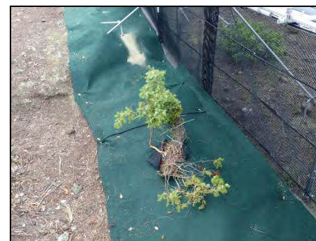
図 Cライン上の貴重種の保護