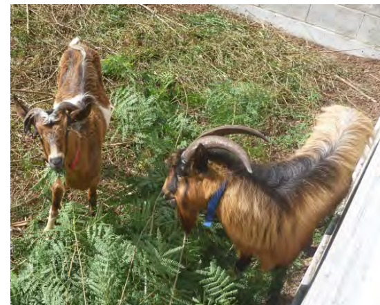
図 ギンネムを食べるノヤギ