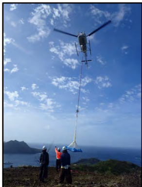
図 ヘリコプター資材運搬 (運搬用具にはお酢を散布)