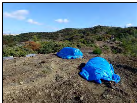
図 資材運搬後の養生 (プラナリア検出板も設置)