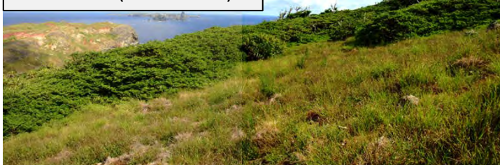
図 ノヤギ根絶前後の植生の回復例(蝶島の例)