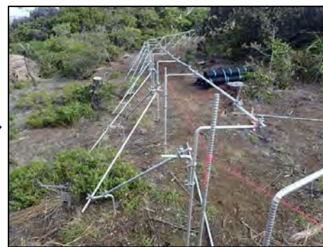
図 支柱の建込作業 (貴重種に留意しライン決定、支柱建込)