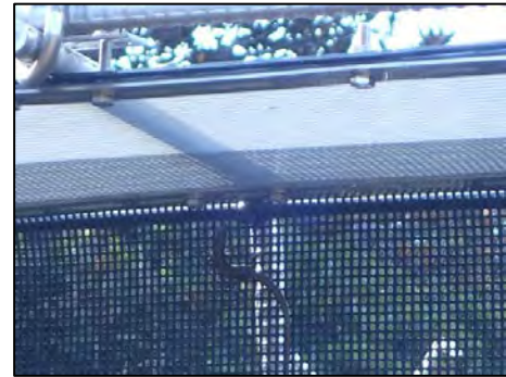
図 オガサワラトカゲは柵で止まる