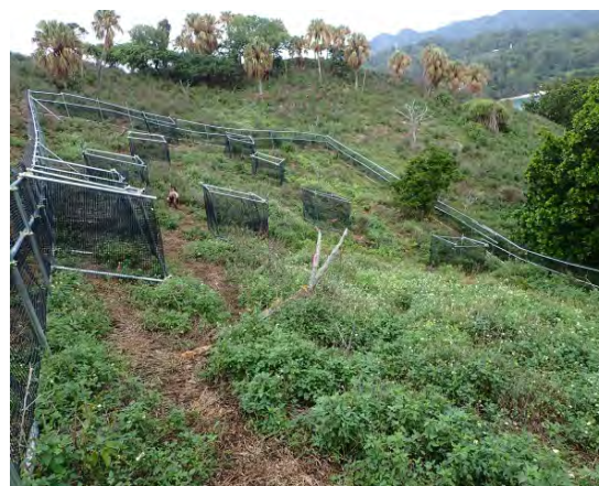
図 摂食試験調査区